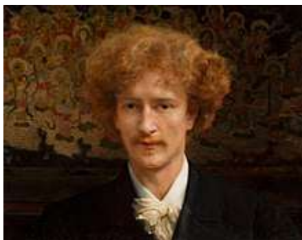
Portret Ignacego Jana Paderewskiego pędzla Lawrence Alma-Tadema, 1891