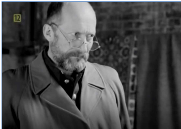
Kadry z filmu Korczak , reż. Andrzej Wajda

Pierwszy kadr to plan pełny. Natomiast drugi to półzbliżenie.